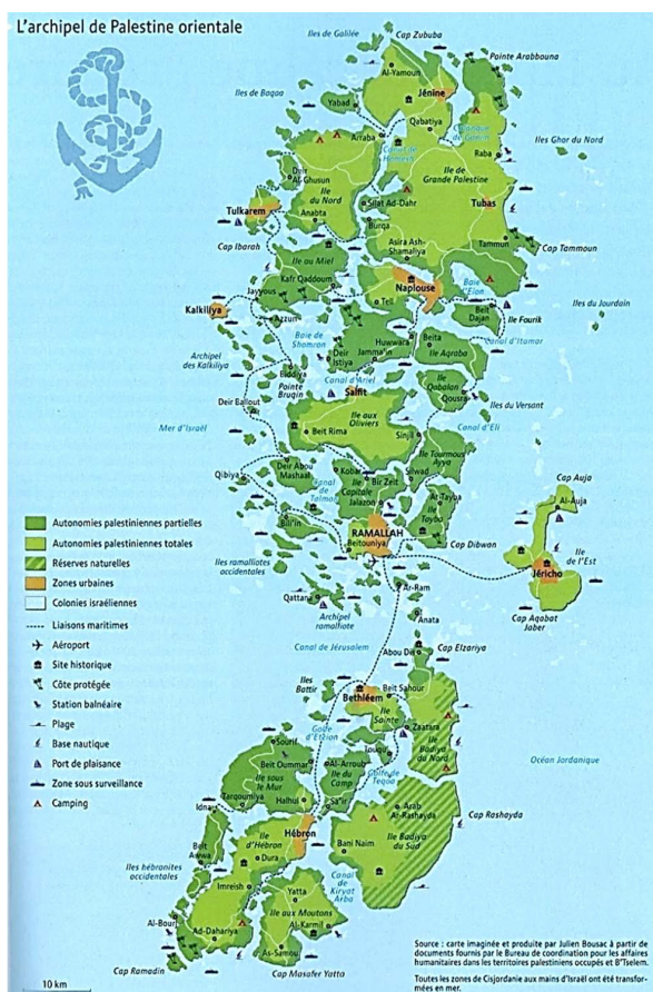
Figura 1 - "L'archipel de Palestine orientale"

Nel 2009, il cartografo-artista Julien Bousac ha disegnato una mappa della Cisgiordania basandosi sui documenti dell'Ufficio delle Nazioni Unite per gli affari umanitari nei Territori Palestinesi occupati e sui dati dell'ONG israeliana per i diritti umani B'Tselem. Intitolata "L'archipel de Palestine orientale", la mappa delinea come "terra emersa" quella sotto amministrazione palestinese, circondata da mare e canali che rappresentano invece i territori sotto controllo israeliano (Fig. 1). 48